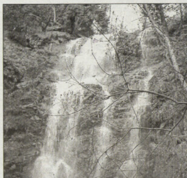
La cascata del Paradiso; a lato, il canyon delle Timpe rosse